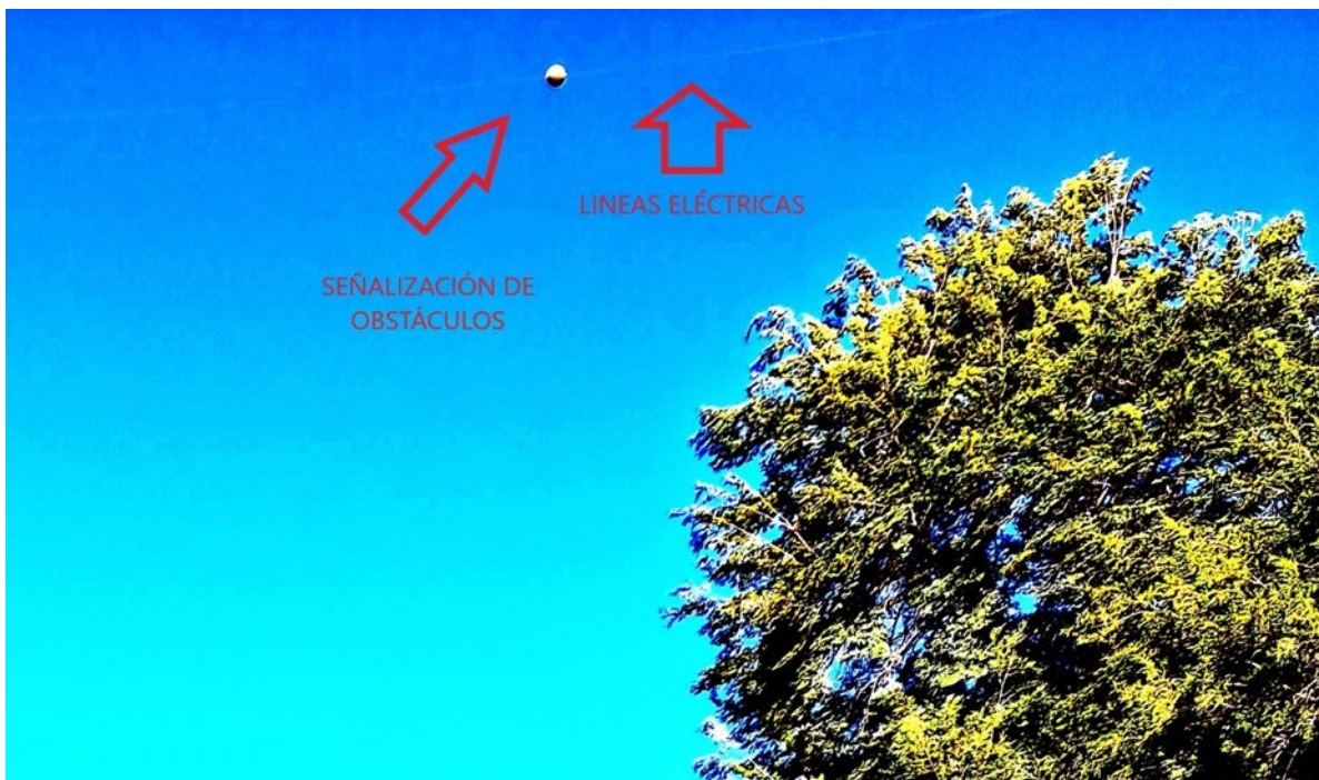
Figura 4. Detalle.