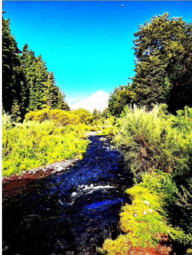
Figura 3. Alto contraste.