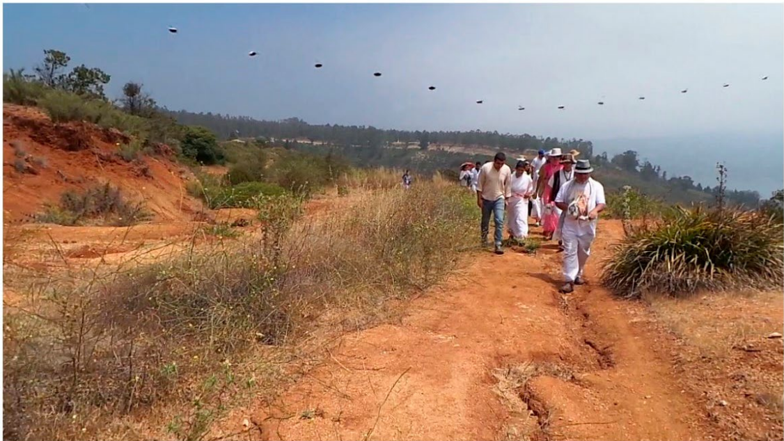
Figura 2. Desplazamiento del objeto reportado. Montaje de los fotogramas 887 a 900.

La Figura 2 corresponde a un fotomontaje que muestra todo su desplazamiento. Apareció desde el borde superior izquierda de la escena y la cruzó ligeramente en diagonal saliendo del encuadre en el sector superior derecho.