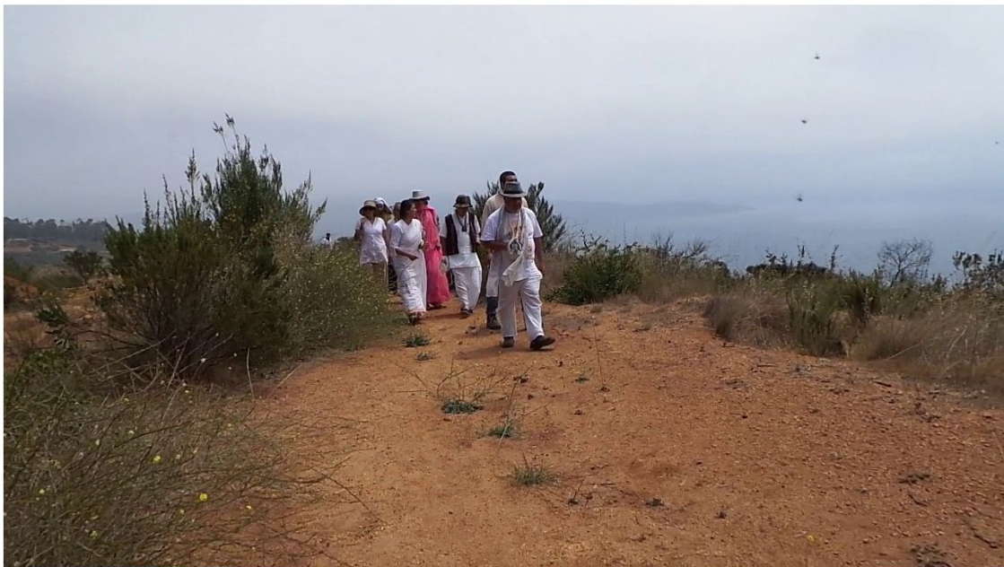
Figura 5. Desplazamiento de objeto reportado. Montaje de los fotogramas 2386 a 2389.

La Figura 5 es un fotomontaje que muestra todo el desplazamiento de un segundo objeto mencionado por el usuario. Apareció desde el borde superior en el tercio derecho del escenario y bajó verticalmente, entrando entre el ramaje de un arbusto. En la Figura 6 se lo muestra tal como quedó plasmado en el fotograma 2388.