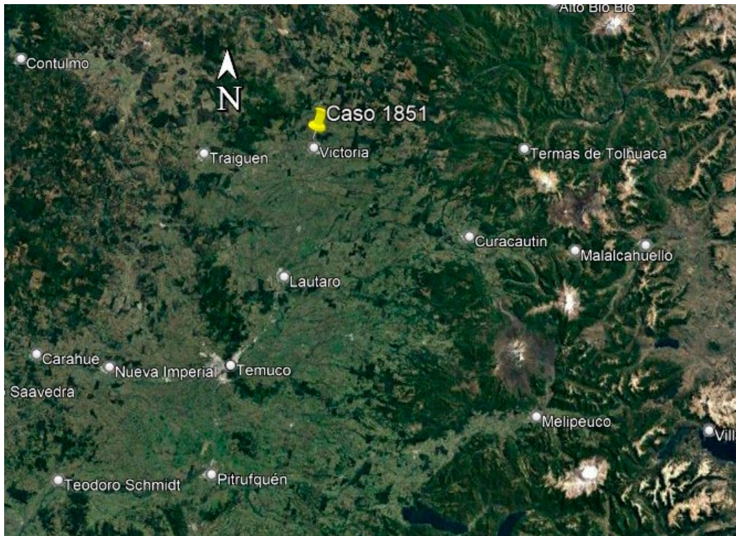
Figura 1. El punto amarillo indica la posición aproximada del testigo al momento del avistamiento.

Se estudió el tráfico aéreo al momento del avistamiento, sin hallar aeronave alguna a la hora indicada con transpondedor activado. (Figura 2)