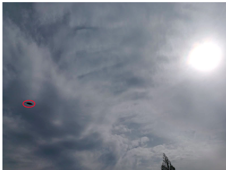
Figura 2. El objeto supuestamente anómalo reportado está enmarcado dentro de un círculo rojo.

Pese a no contar con una copia del original, un vistazo a la imagen enviada permite determinar que, por su parecido a otras muchas imágenes recibidas y examinadas por la SEFAA, el objeto aparentemente anómalo captado en la fotografía es un ave que se desplaza hacia la derecha. (Figura 2)