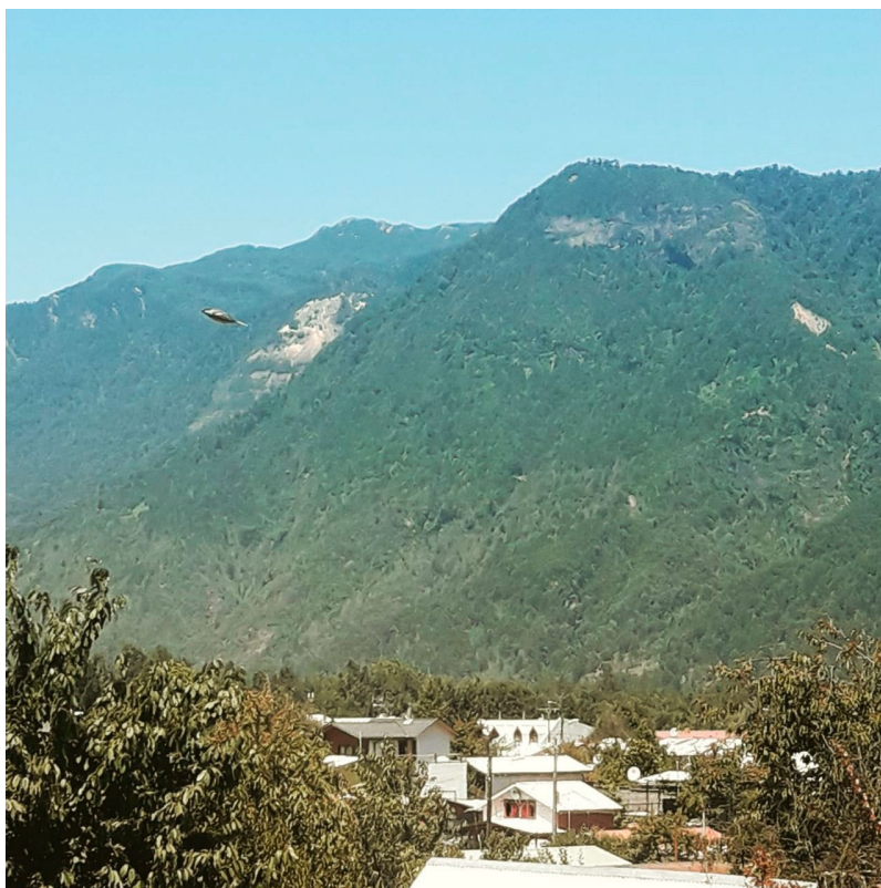
Figura 4. Ave volando en ascenso y hacia la izquierda, reportada como presunto fenómeno aéreo anómalo en el caso 827 24052018.

Huelga decir que desde su creación en octubre de 1997, el ex CEFAA y actual SEFAA ha recibido decenas de fotografías parecidas que han correspondido a aves en vuelo, como la del caso 827 2052018, que se adjunta a continuación (Figura 4):