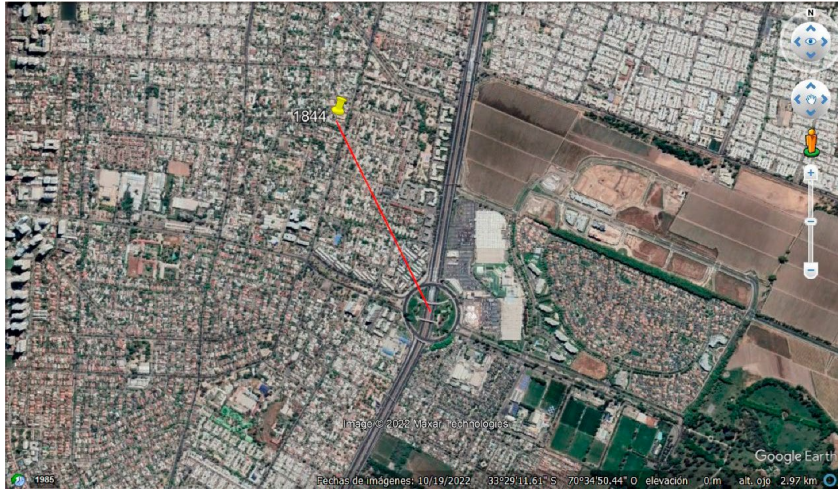
Figura 1. El punto amarillo indica la posición aproximada del testigo y el círculo indica el lugar aproximado donde habría estado el fenómeno reportado.

Con el fin de constatar un posible tráfico aéreo en la zona a la hora y fecha de la imagen aportada, se estudió el tránsito aéreo, constatándose que no existieron operaciones aéreas en el área reportada. (Figura 2)