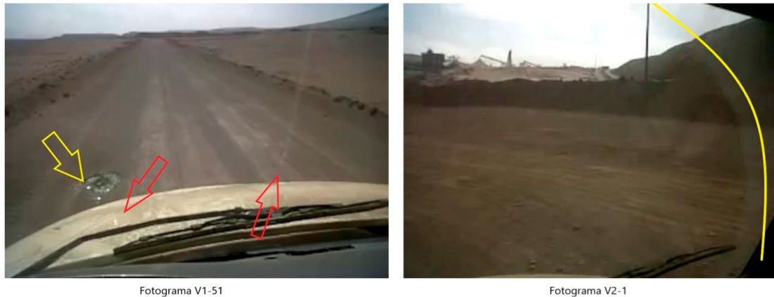
Figura 5. Fotogramas del video "avistamiento de ovnis en michilla-CHILE_360P.mp4".

Los fotogramas mostrados en la Figura 6 demostraron que el Sol también se reflejó en objetos que estaban al interior de la cabina y que pudieron asimilarse a los "rayos" mencionados en el testimonio.