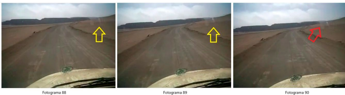
Figura 6. Fotogramas del video "Avistamiento ovni II michilla - chile.mp4".

Los fotogramas mostrados en la Figura 6 demostraron que el Sol también se reflejó en objetos que estaban al interior de la cabina y que pudieron asimilarse a los "rayos" mencionados en el testimonio.