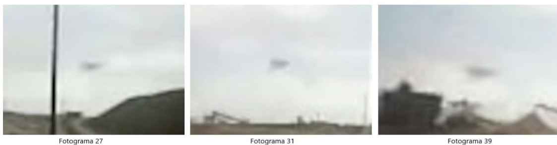
Figura 8. Fotogramas del video "avistamiento de ovis en michilla-CHILE_360P.mp4".

Imágenes: El usuario no entregó ninguno de los archivos de las filmaciones originales o que albergó en YouTube, solamente los enlaces a estas publicaciones. Por lo mismo, lo único disponible para estudiar la situación es material audiovisual parcial y editado.