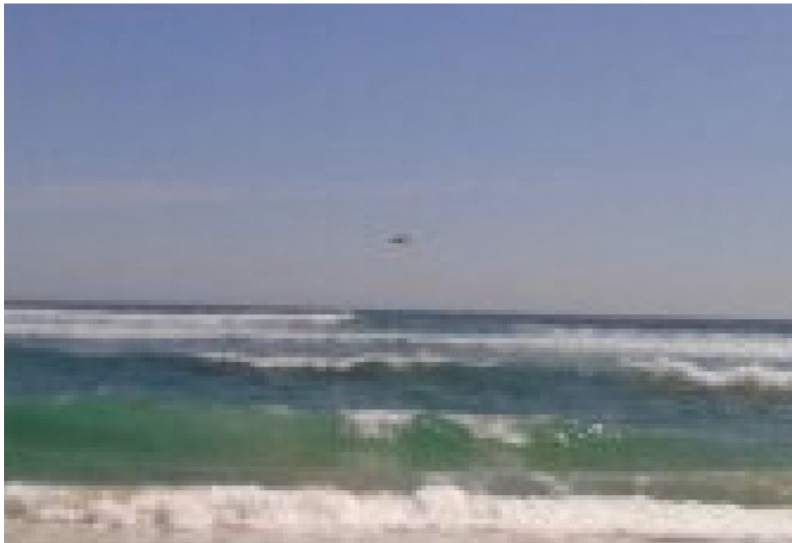
Figura 2. Lo reportado de la imagen 877-3, con 400 aumentos.

Tal como se aprecia en la Figura 2, la silueta disponible del objeto en estudio se encuentra altamente pixelada, lo que es congruente con haber ampliado una fotografía originalmente muy pequeña. No existiendo puntos de referencia con los cuales determinar su distancia a la cámara, tampoco fue posible poder