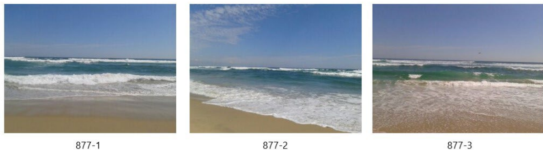
Figura 1. Fotografías del caso, en su tamaño completo.

La Figura 1 muestra en sus tamaños completos a las imágenes disponibles. Lo reportado se encuentra ligeramente sobre el horizonte en la última imagen.