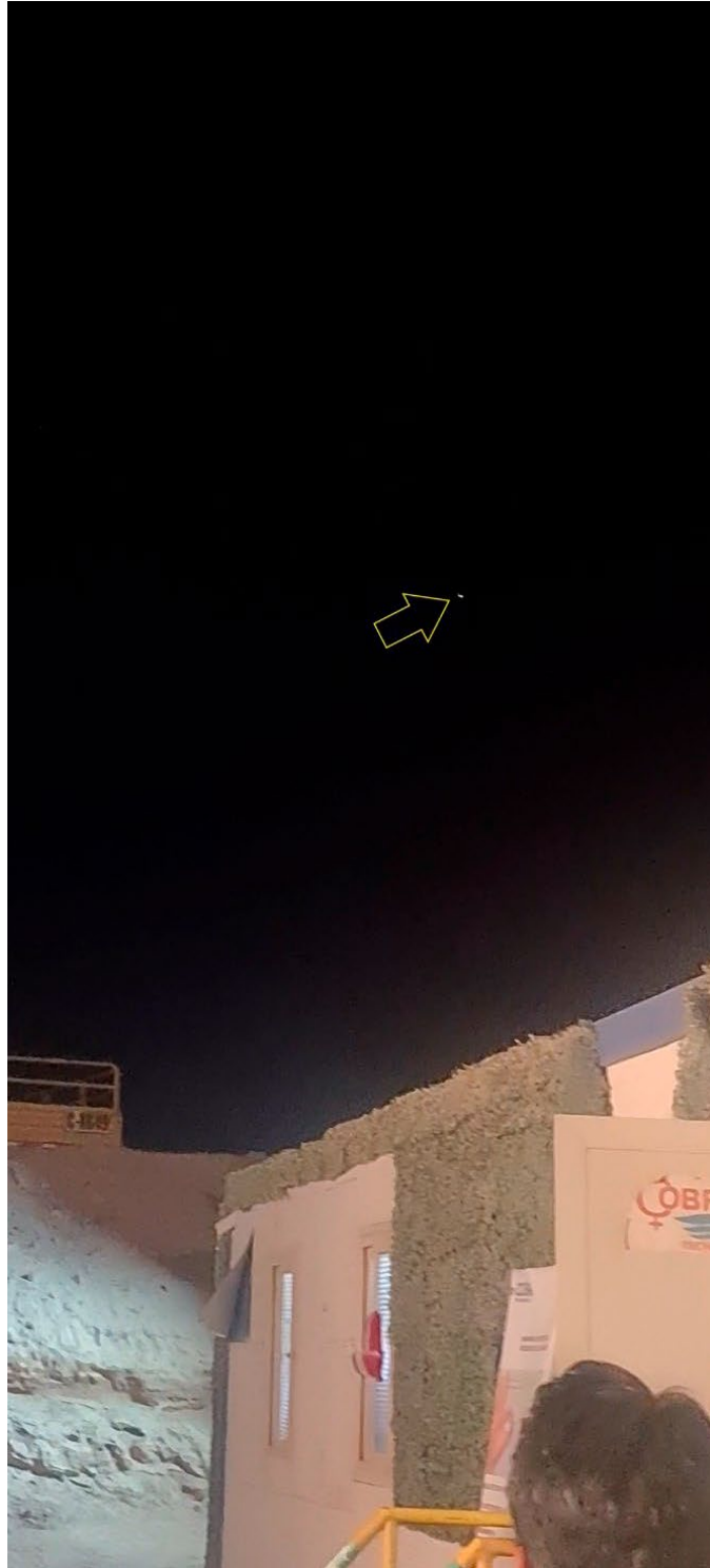
Figura 2. Lo informado (flecha amarilla) tal como aparece en el fotograma 14 de la filmación del caso.

Se perició la filmación original del caso, examinando la información contenida en el archivo digital, constatándose que lo grabado fue captado en el momento reportado. Lo filmado se analizó extrayendo y estudiando cada uno de sus 2.435 fotogramas.