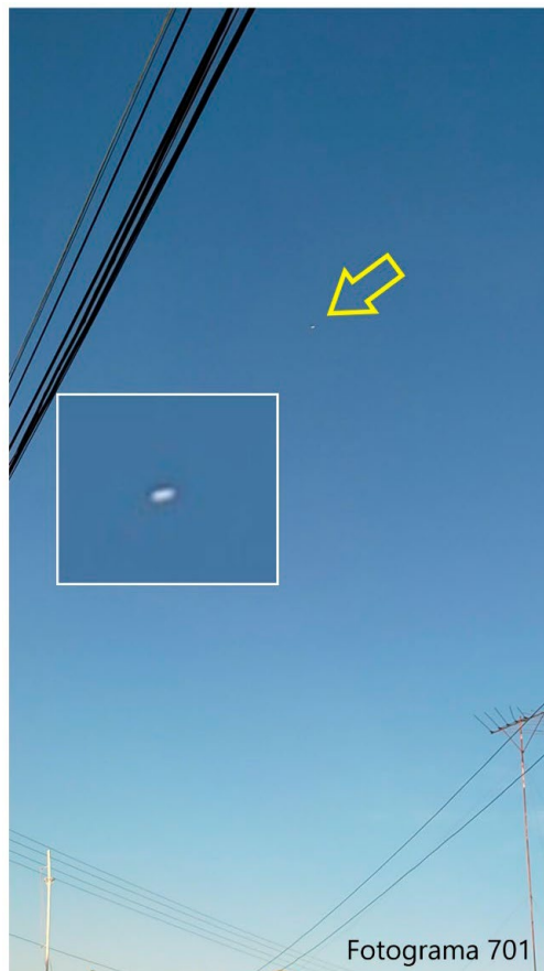
Figura 2. Lo reportado (flecha amarilla) y su ampliación.

De la filmación se extrajeron y estudiaron cada uno de sus 3.860 fotogramas. La siguiente Figura 2 muestra al objeto en estudio tal como es visible en el cuadro 701 junto a una ampliación: