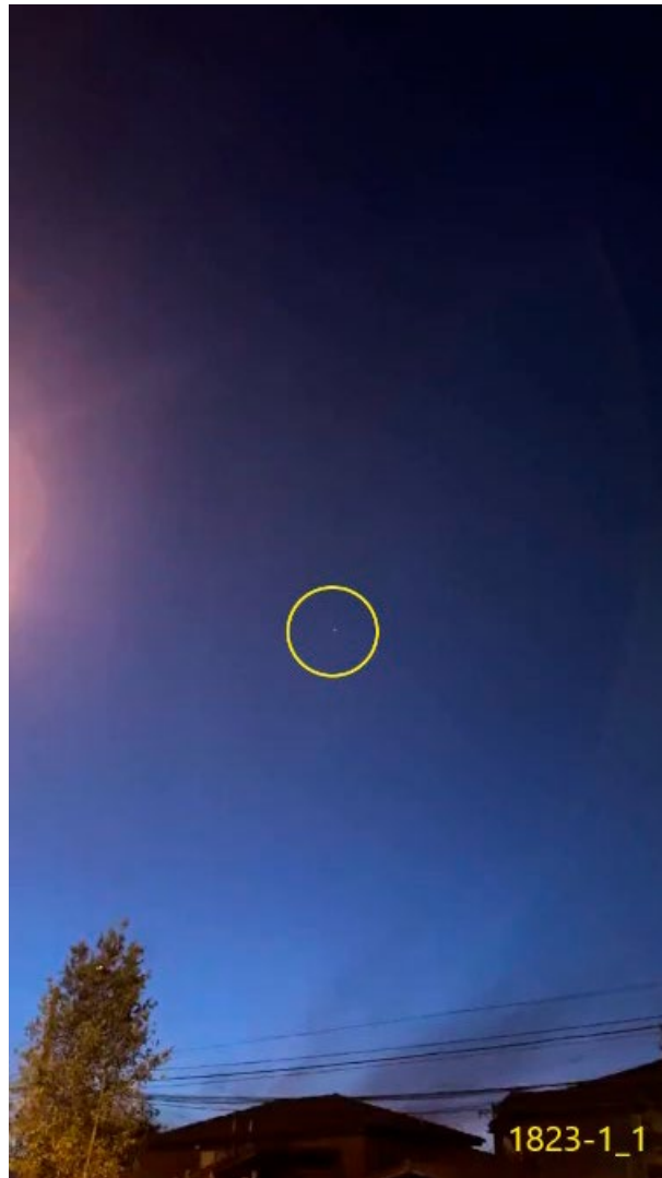
Figura 2. Lo reportado tal como fue visible sin aumentos en el fotograma de la filmación 1823-1, marcado al interior de un círculo amarillo.