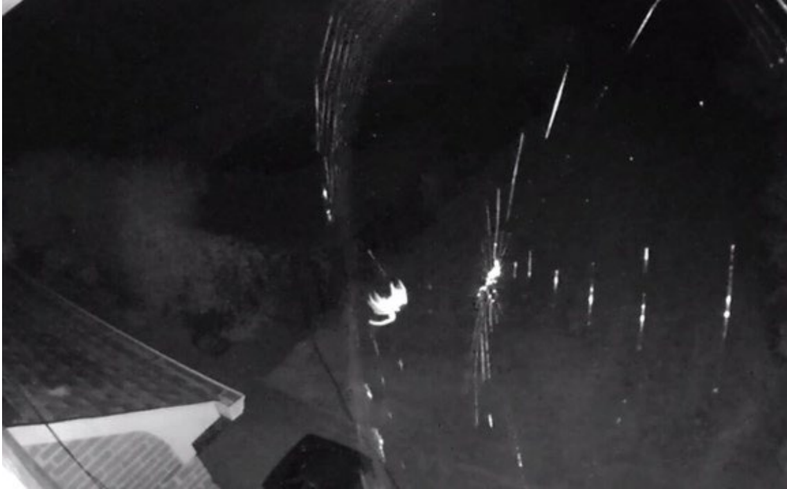
Figura 4. Filmación de araña y su tela.

Imágenes: El informante aportó una filmación en un archivo en formato mp4.