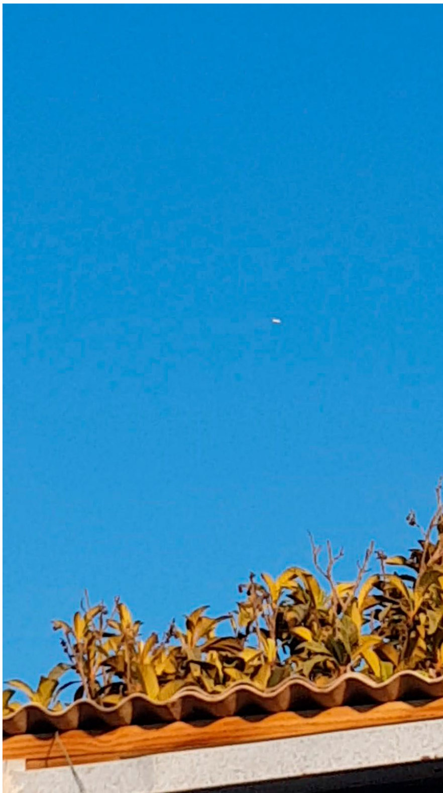
Figura 1. Lo reportado en el fotograma 500.

La Figura 1 muestra al objeto en estudio tal como es visible en el fotograma 500.