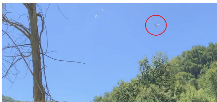
Figura 1. Lo reportado (círculo rojo) presente en uno de los archivos enviados.

Junto al reporte se ingresaron dos archivos en formato png. (Figuras 1 y 2)