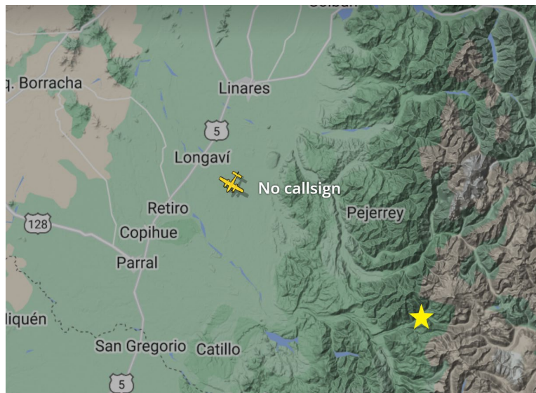
Figura 6. Situación del tránsito aéreo a las 14:41 horas del 8 de marzo de 2022. Una estrella amarilla indica desde donde se grabó.

Al estudiar la situación de tráfico aéreo en la zona, se constató el sobrevuelo de una aeronave hacia el noroeste y al momento de la filmación. (Figura 6)