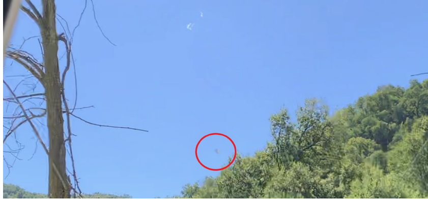
Figura 2. Lo reportado (círculo rojo) presente en el segundo archivo.

El reporte se estudió a partir del análisis de cada uno de los 948 fotogramas de la filmación que originó el caso. El examen de la información contenida en los archivos enviados definió que estos se originaron en un teléfono celular Apple, modelo iPhone iPhone XS Max. A partir de lo visible y de la información almacenada en la grabación, se georreferenció la localización desde donde se obtuvieron las imágenes. Este sitio se encuentra en el sector de Pejerrey, próximo a la ribera norte del río Longaví, en las coordenadas 36^{\circ} 13' 46'' Latitud Sur, 71^{\circ} 22' 28'' Longitud Oeste y a 582 metros sobre el nivel del mar. (Figura 3)