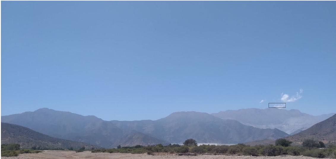
Figura 1. Imagen 1382-1. Al centro del rectángulo negro se encuentra lo reportado.

Las dos fotografías se muestran en las Figuras 1 y 2.