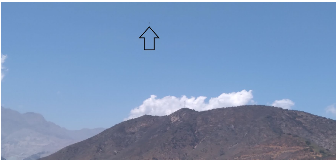
Figura 2. Lo reportado se marca con una flecha negra.

Por otra parte, la filmación se realizó a las 19:01 del 9 de diciembre de 2020, es decir, 24 días antes de la fecha reportada para el caso.