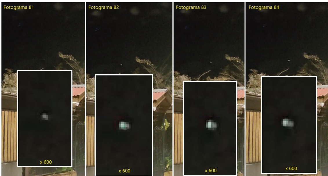
Figura 4. Variación en la intensidad y coloración de la iluminación de lo reportado en cuatro fotogramas seleccionados del video del caso.

Los fotogramas mostrados en la Figura 4 evidenciaron que el objeto poseía iluminación propia, que presentó las características propias de luces de navegación aérea. Entre cada una de esas imágenes existió un desfase de 1/30 de segundo, lo que junto a la distancia, al tamaño del objeto y la existencia del parabrisas dificultaron que fueran visibles y asociables a un tráfico aéreo convencional por las testigos.