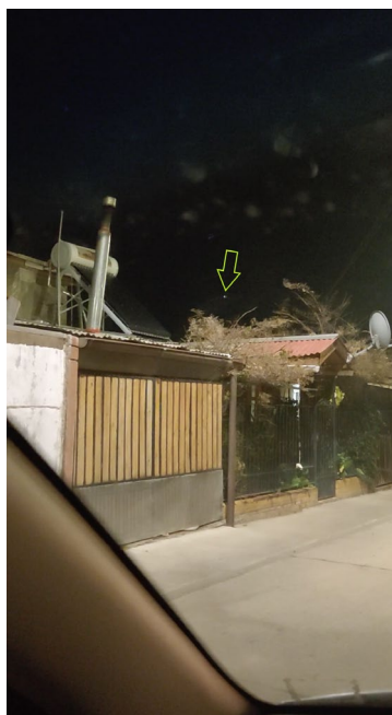
Figura 2. Lo reportado tal como aparece en el fotograma 259 de la filmación del caso.

Y tal como muestra la Figura 3, el objeto en vuelo mostró dos tipos de luces: una blanca y otra verde.