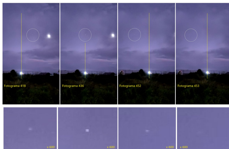
Figura 3. Variación de brillo y tamaño de lo reportado.

Junto con el testimonio del informante de no haber visto nada hasta revisar el grabado, todo lo anterior resultó consistente con que los objetos luminosos antes descritos fueron reflejos parásitos solamente presentes al interior de los lentes de la cámara y originados al enfrentarse directamente a una luminaria que había en la escena retratada.