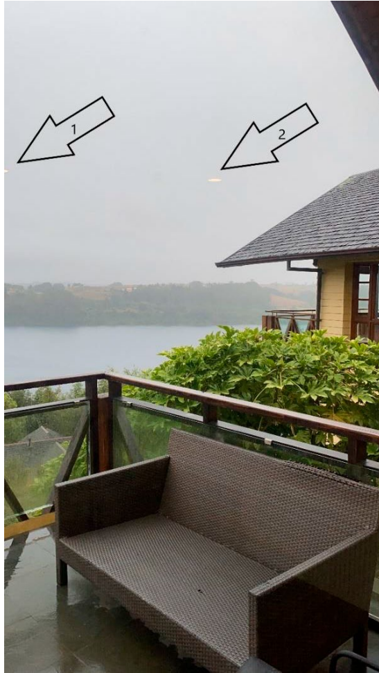
Figura 1. Imagen 1783-1.

Se georreferenció la ubicación del usuario en las coordenadas 41^{\circ} 11' 27'' Latitud Sur y 73^{\circ} 0' 10'' Longitud Oeste, a 116 metros sobre el nivel del mar. (Figura 2). Esto corresponde al sector de Punta Larga, al sur de Frutillar y el escenario retratado es visible hacia el suroeste. (Figura 3)