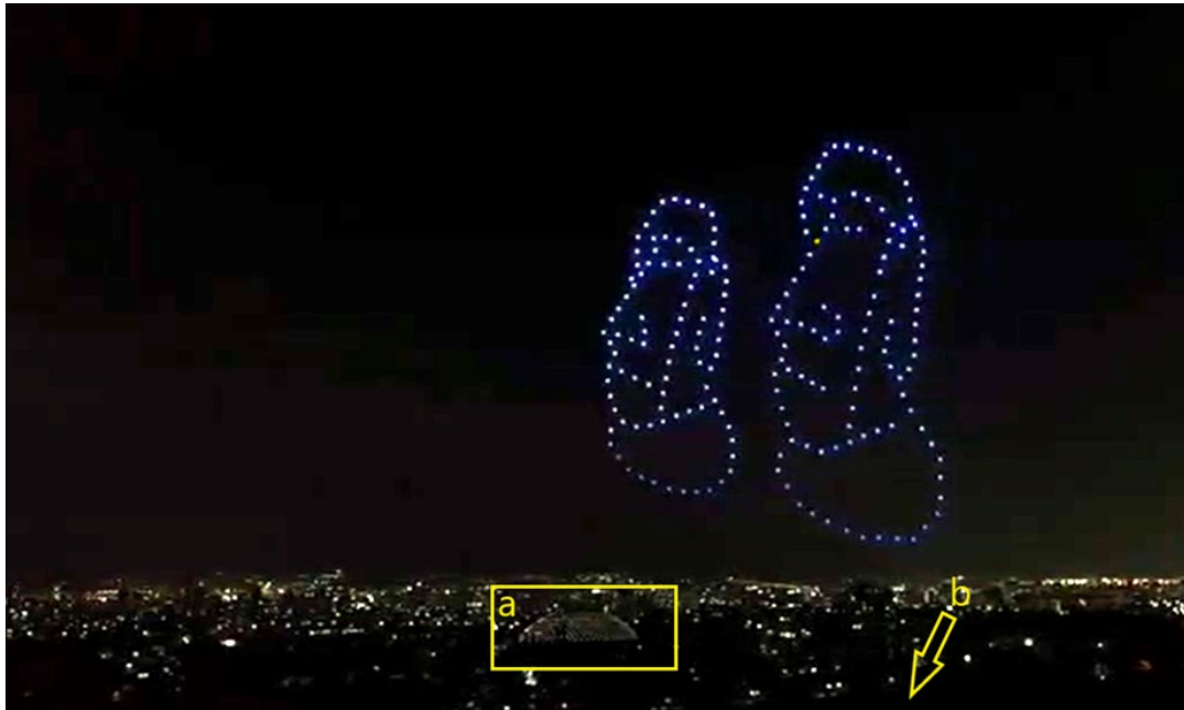
Figura 2. Espectáculo aéreo del 16 de enero de 2022. Cúpula Multiespacio del Parque O'Higgins (a) y localización del Club Hípico (b).

Ante la posibilidad de estar frente al vuelo de naves del tipo RPA, se consultó a un inspector de operaciones aéreas que es asesor externo de la SEFAA. Además, ante el panorama de que existiera algún tráfico aéreo no señalado públicamente, se consultó al respecto a un controlador de tránsito aéreo y asesor externo de la SEFAA.