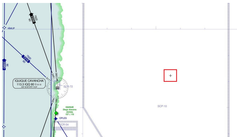
Figura 3. La posición de estudio se ha marcado al interior de un cuadro rojo.