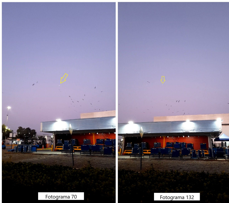
Figura 2. Fenómenos reportados tal como aparecen en los fotogramas 70 y 132 de la filmación del caso.

La siguiente Figura 2 muestra lo visible en dos fotogramas del inicio y fin de la grabación. El del cuadro 70 corresponde a un objeto luminoso que aparentemente se movió de izquierda a derecha y el del fotograma 132 lo habría hecho en sentido inverso.