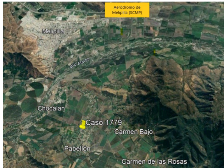
Figura 3. Localización de la usuaria y zona de avistamiento.

De acuerdo a la usuaria, el objeto habría volado sobre los cerros del sector de Carmen Bajo, que se encuentra al noroeste de donde estaba ella y al sureste del aeródromo de Melipilla. Estos cerros tienen cotas cercanas a los 800 metros sobre el nivel del mar.