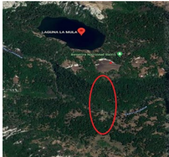
Figura 3. De acuerdo a lo señalado por el usuario, un punto rojo marca su localización y una elipse roja señala los cerros en los cuales perdieron de vista a lo informado.