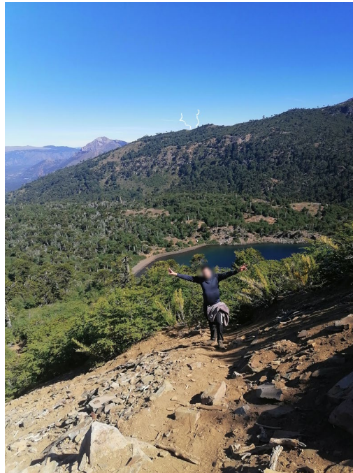
Figura 1. Ilustración de lo reportado.

En un correo electrónico del 9 de marzo de 2022, el usuario confirmó que no vio nada de lo que pudo originar la huella que divisó en el cielo y que todo esto pudo suceder entre las 15:00 y 19:00 del 5 de marzo. También corrigió el lugar en el que se encontraban y precisó hacia dónde vieron la reportado (Figura 3). La Figura 4 muestra con mayor detalle el contexto geográfico de ese lugar.