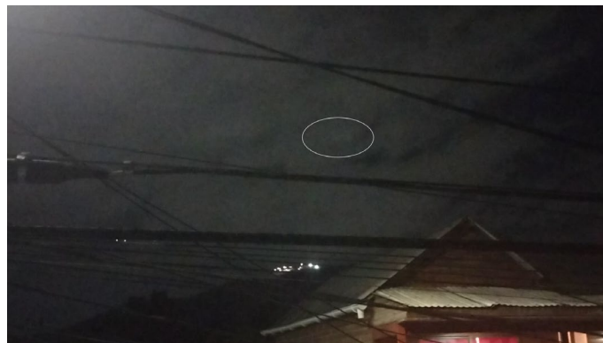
Figura 1. Lo reportado en el fotograma 161.

Este caso tiene como apoyo una filmación, cuyo fotograma 161 se muestra en las Figuras 1 y 2 con lo reportado al interior de óvalos gris y amarillo, respectivamente.