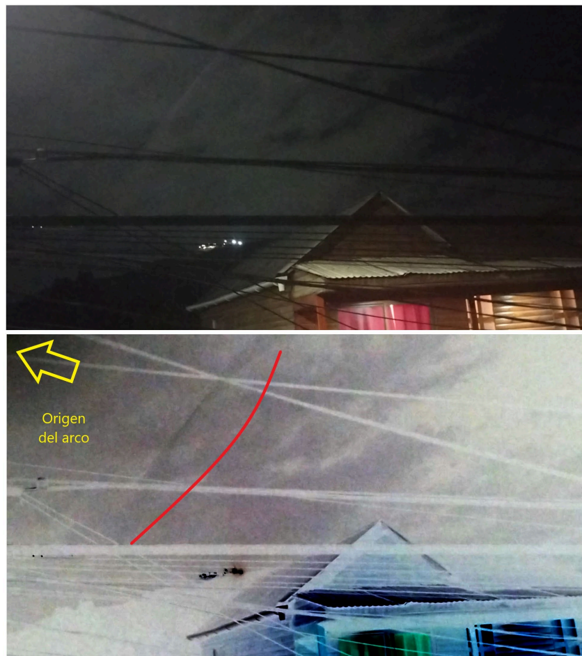
Figura 3. Reflejo del fotograma 395.

Fuera de lo reportado y a pesar que no lo declaró así, la filmación está realizada en condiciones que eran propicias para la presencia de reflejos, los que son visibles en algunos fotogramas, como, por ejemplo, el arco luminoso, asociado a una fuente de iluminación cuyo resplandor está situado en el vértice superior derecho de la escena. La Figura 3 muestra esto tal como es visible en el fotograma 395.