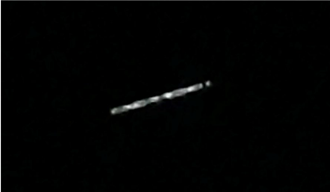
Figura 2. Detalle de lo reportado en el fotograma 80.

Como el despliegue de las naves se encontraba en una etapa inicial, aún se encontraban muy próximas unas a otras y eventualmente pudieron ser consideradas como si se tratara de un solo gran objeto volador o, como testimonió el usuario, un “tipo de foco de luz led”. (Figura 2)