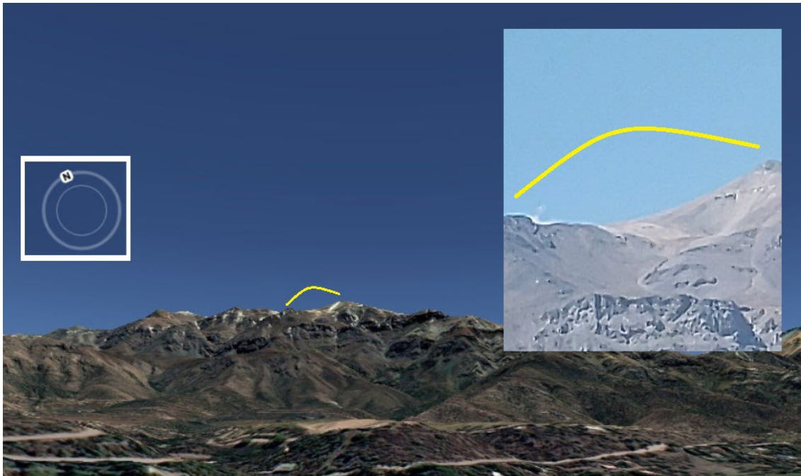
Figura 3. Orientación de la filmación.

Tal como muestra la Figura 3, la toma se realizó hacia el nor-noreste del usuario y las cimas de la escena distaban aproximadamente 10,3 kilómetros.