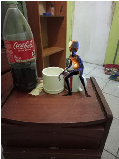
Imagen enviada por el usuario