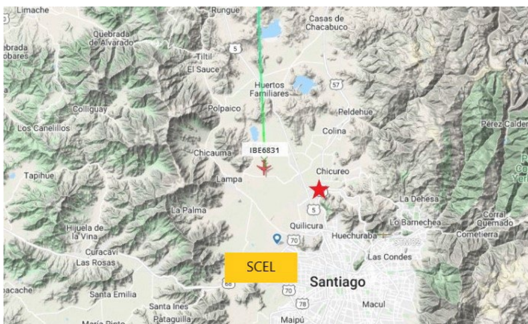
Figura 3. Posiciones del vuelo Iberia y del usuario (estrella roja).

A las 22:44 horas se desplazaba por el cielo un avión Airbus A330-202 que terminaba el vuelo IBE6831 de LEVEL Airlines (Iberia) entre el Aeropuerto Adolfo Suárez Madrid-Barajas y SCEL. En ese momento iba en rumbo 177° a 3.600 pies y 178 nudos. (Figura 3)