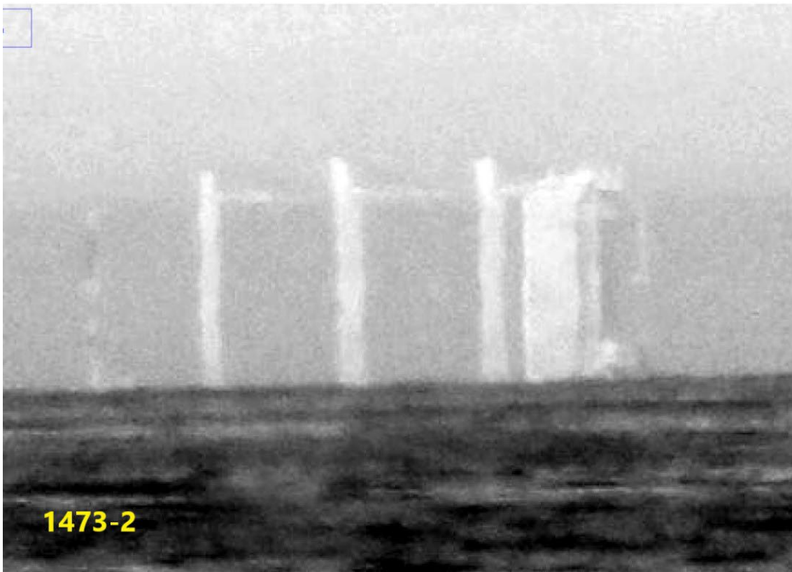
Figura □ Lo reportado con 200 acercamientos.

La relativa cercanía del lugar reportado al puerto de Antofagasta y su aspecto hizo que se levantara la hipótesis de encontrarse frente a algún tipo de fenómeno óptico de ocurrencia naval. Por ello se consultó a un oficial piloto de enlace de la SEFAA con la Comandancia de la Aviación Naval de la Armada de