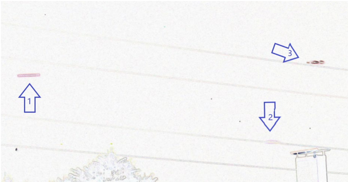
Figura 3. Fenómenos reportados señalados con flechas azules.

Al estudiar la imagen geoméricamente, se constató la existencia de simetrías con respecto al centro focal de la fotografía y que lo reportado correspondió a reflejos parásitos y no a objetos presentes en la escena. (Figura 4)